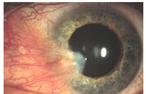
Figuur 1: Pterygium

Een pterygium komt ook vaker voor bij mensen die veel buiten hebben gewerkt. Een enkele keer is een pterygium een bijverschijnsel of gevolg van ontstekingen aan het hoornvlies en/of de harde oogrok (sclera).