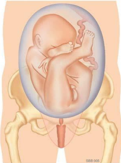
Onvolkomen stuitligging: De benen liggen omhoog naast het lichaam.