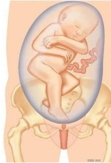
Voetligging: De baby ligt met één of beide benen gestrekt naar beneden. Eén of twee voeten liggen lager dan de billen.