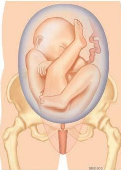
Half onvolkomen stuitligging: Eén been ligt gestrekt naar boven. Het andere been ligt gebogen naar beneden.