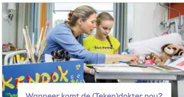
Wanneer komt de (Tekend)okter nou?