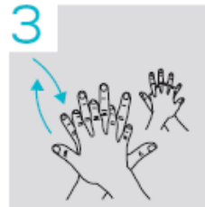
3 Rechterhandpalm op de linkerhandrug en omgekeerd