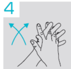
4 Handpalmen op elkaar en tussen de vingers