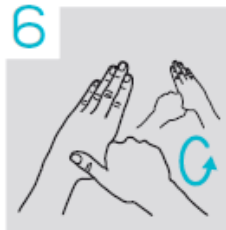
6 Duimen links en rechts inwrijven