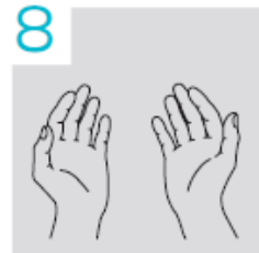
8 Blijven wrijven tot de handen droog zijn

Deze instructiekaart voor handhygiëne hoort bij de werkprocedure 'Handhygiëne'.