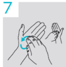
7 Vingertoppen links en rechts op de handpalm wrijven en als laatste rond de polsen