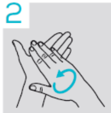
2 Handalcohol verdelen over de handen en polsen