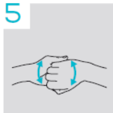
5 Knokkels in de handpalmen wrijven