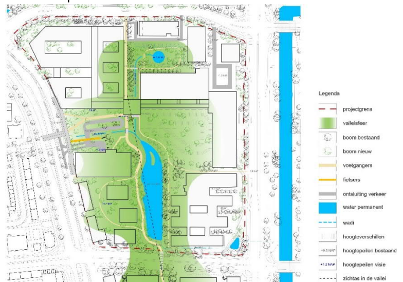
Plankaart van het Spaarne Gasthuisbuurt uit het beeldkwaliteitsplan

Vanwege de coronacrisis kunnen we niet, zoals gebruikelijk, een fysieke inloop-bijeenkomst organiseren om het ontwerp bestemmingsplan te presenteren en van uitleg te voorzien. In plaats daarvan organiseren we een online webinar.